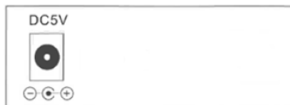
Abb. Rückseite mit Stromanschluss DC