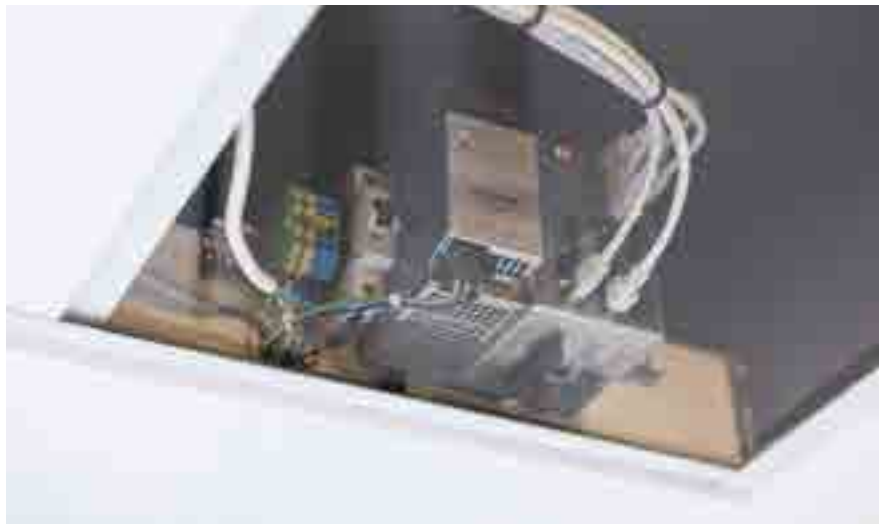
MICROSENS Smart Engine übernimmt die Energieversorgung der Leuchten

Die Smart Engine übernimmt die Energieversorgung der Leuchten mit Power-over-Ethernet Plus. Sie verwendet dazu geeignete, handelsübliche Datenleitungen, wie sie auch für die IT-Infrastruktur verwendet werden. Die Smart Engine kann in einem DV-Schrank oder Elektroverteiler untergebracht sein, aber auch direkt dezentral z. B. in einer abgehängten Decke verbaut werden. Die Anzahl der Engines bestimmt sich nach Umfang und Ausbau der Beleuchtung.