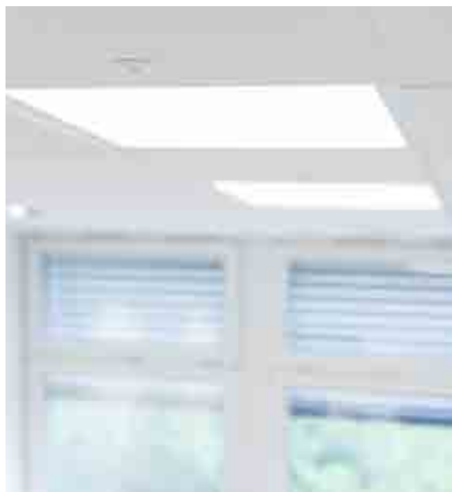
Modernes LED-Panel mit Smart Sensor

Die Beleuchtung wird vollständig in die Infrastruktur für verteilte Gebäudesysteme integriert und wird damit Teil der informationstechnischen Anlage. Die Strombegrenzung seitens der speisenden Geräte (englisch: Power Sourcing Equipment, kurz: PSE) wie der Smart Engine der LED-Beleuchtung sorgt für ein zusätzliches Maß an Sicherheit. Wird die Engine darüber hinaus wie in der IT üblich über eine USV abgestützt, funktioniert die Beleuchtung auch bei Stromausfall.