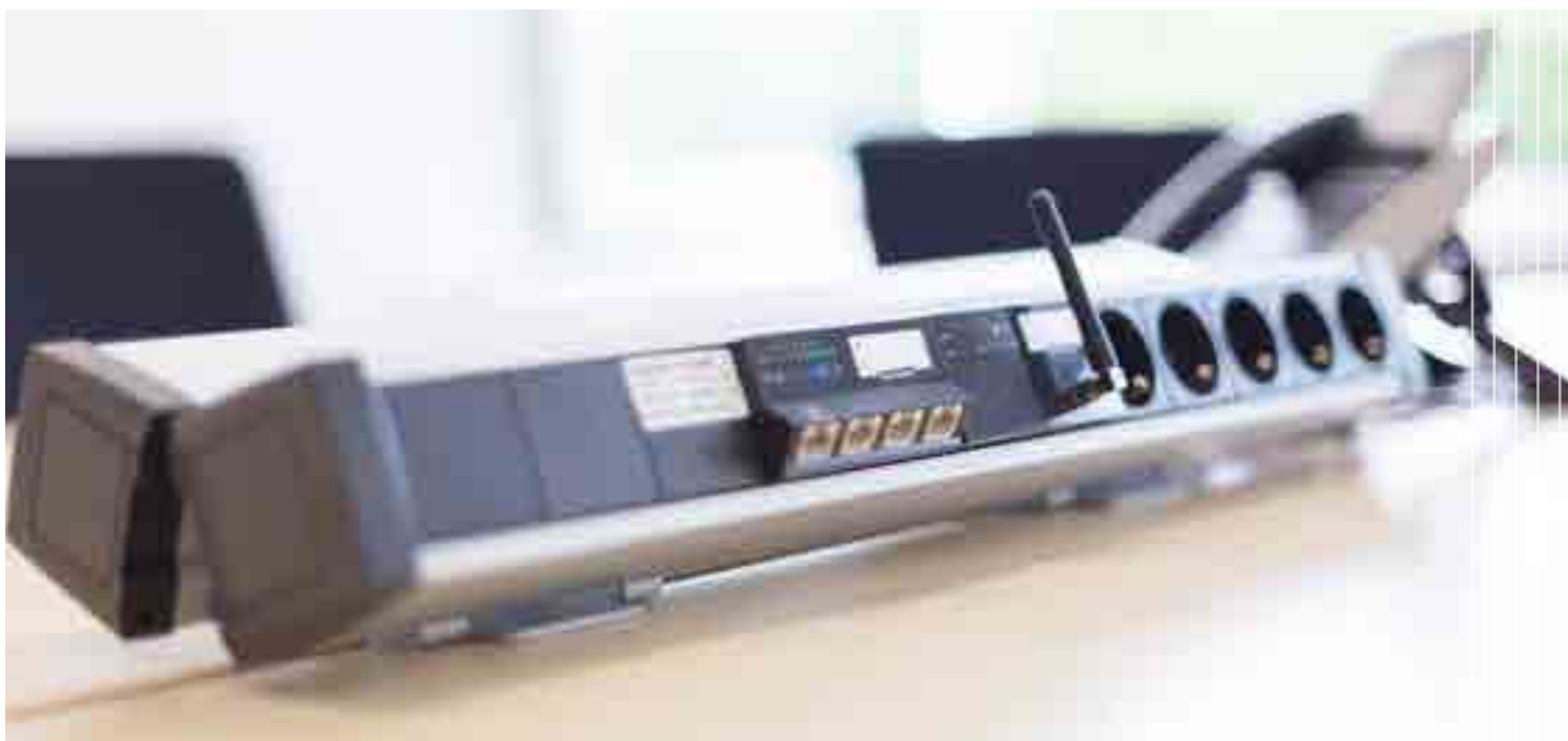
Die Schaltzentrale - MICROSENS Micro-Switch samt Micro Access Point