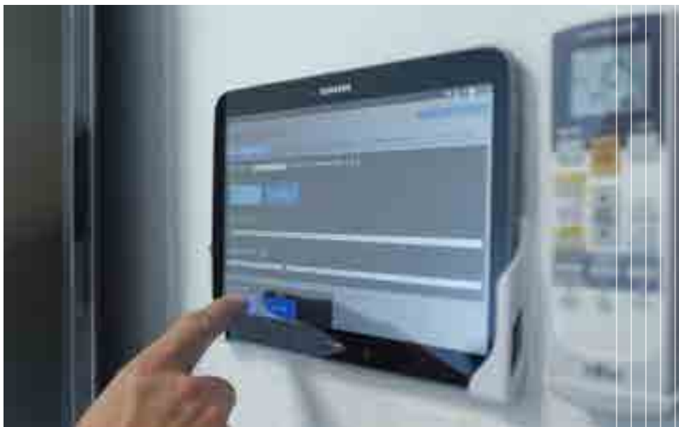
Nutzerfreundlich – Licht-Steuerung per Tablet oder Smartphone

Da die Stromversorgung PoE-fähiger Geräte direkt über den Datenanschluss erfolgt, ist ein 230 V-Anschluss nicht notwendig. Durch den Einsatz von Kleinspannung wird weder für die Geräte noch für die notwendige Infrastruktur eine Elektrofachkraft für Installation und Wartung benötigt.